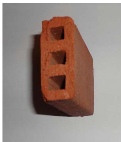
Sédiment de Tanger