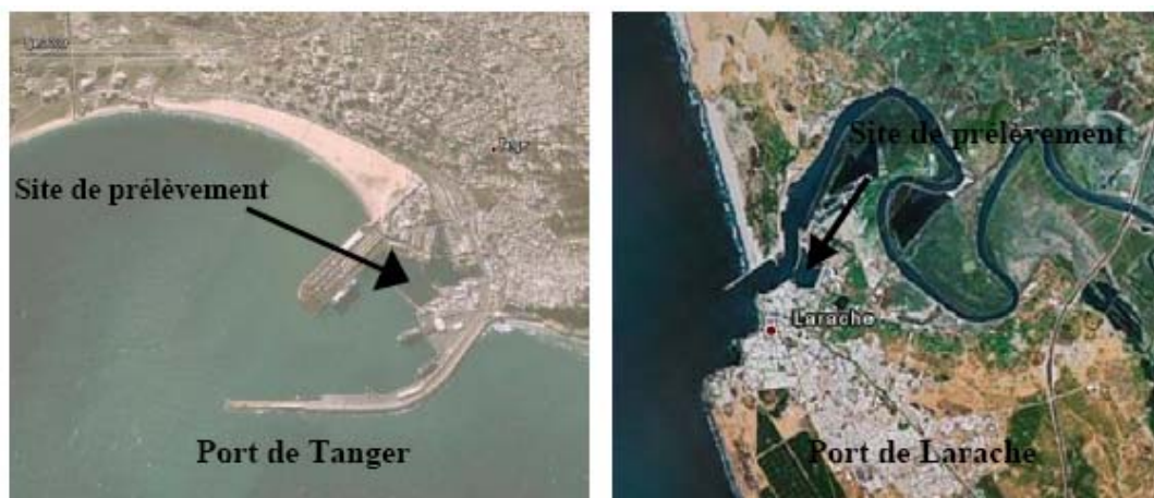
Figure 1. Sites de prélèvement des sédiments.

Les sédiments étudiés ont été prélevés dans les ports de Tanger et de Larache (figure 1). Grâce à sa position stratégique entre l'Atlantique et la Méditerranée, le port de Tanger est le premier port marocain dans le trafic des passagers et du transit international routier.