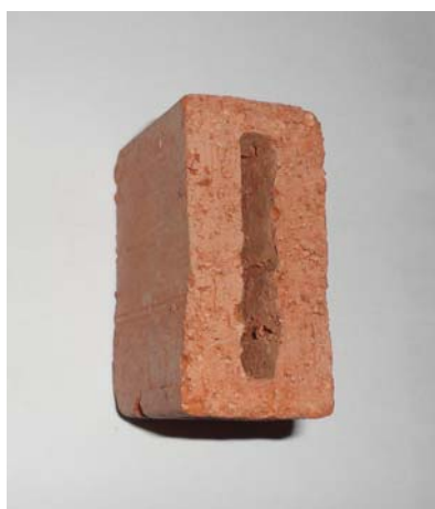
Sédiment de Larache

La préparation des échantillons de briques consiste en un mélange de 70% de sédiments et 30% d'argile. Après séchage à l'air libre, les trois matériaux (sédiment de Larache, sédiment de Tanger et argile) sont broyés puis tamisés à 1 mm. Après malaxage, moulage et séchage de la pâte, les briques-éprouvettes sont séchées à une température de cuisson de 920 °C pendant 32 heures. Les premiers constats sont encourageants puisque la fabrication de briques s'est révélée possible. Les photos de la figure 3 montrent l'aspect des briques obtenues en substituant 70% de l'argile utilisée par les sédiments de dragage.