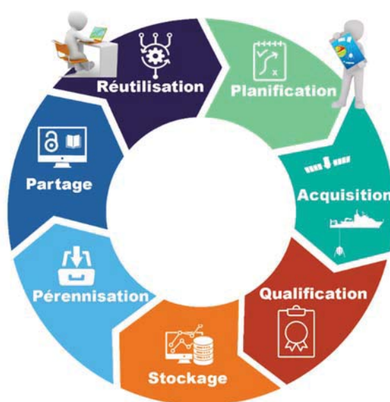
Figure 2. Le cycle de vie de la donnée.

L'offre de service d'ODATIS porte sur les différentes étapes du cycle de vie de la donnée. Le cycle de vie de la donnée désigne les étapes et les flux par lesquels une donnée passe depuis la planification d'un projet et sa collecte jusqu'à sa publication, voire sa réutilisation (Figure 2). Les données ont souvent une durée de vie plus longue que le projet de recherche qui les a créées. De nombreux appels d'offre nationaux et européens exigent désormais que les projets lauréats produisent un plan de gestion des données (PGD, Data Management Plan DMP ).