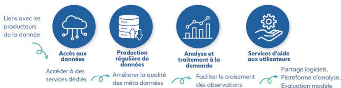
Figure 3. Du producteur à l'utilisateur des données.

Pour tirer le meilleur bénéfice des flux de données croissants, ODATIS propose des moyens pour analyser et traiter de grands volumes de données à distance sur les centres de calcul à haute performance (HPC). Des accès aux clusters de calcul du CNES, HAL, et de l'Ifremer, DATARMOR, sont possibles sur la base d'une description détaillée du besoin en lien avec ODATIS ( https://www.odatis-ocean.fr/contact ).